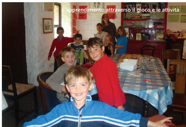
L'apprendimento attraverso il gioco e le attività

Letterfrack e Connemara sono popolari destinazioni di vacanza con numerose attrazioni che le famiglie possono visitare nel pomeriggio.