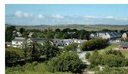
Letterfrack, Co. Galway, Ireland 1,15 ore da Galway 3,15 ore da Dublino

Il Connemara è un luogo in cui le persone ritornano e i visitatori sono accolti a braccia aperte.